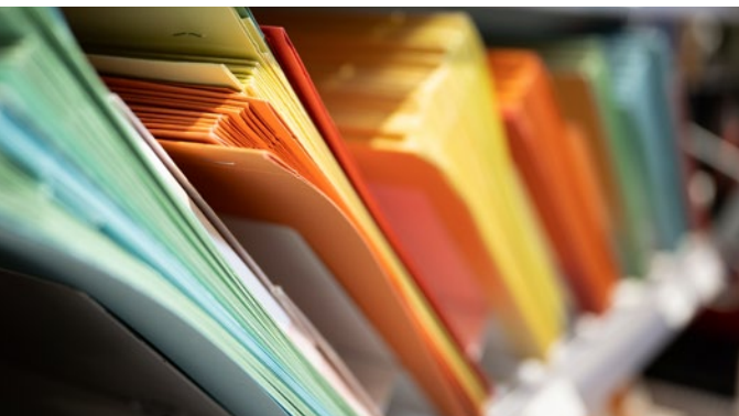
Schnellhefter in mehreren Farben

Ein Blick auf den Schreibtisch-Arbeitsplatz im Büro oder im Home Office verrät, dass beim täglichen Arbeiten viele unterschiedliche Produkte eingesetzt werden – vom Papier über Kleingeräte bis hin zu Schreibgeräten. Bei mehr als 4 Millionen Erwerbstätigen kann ein umweltfreundlicher Einkauf große Vorteile für den Klimaschutz bringen. Oft können schon kleine Entscheidungen eine große Wirkung entfalten. Jede Entscheidung zählt!