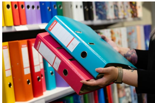
Frau mit Büroordner